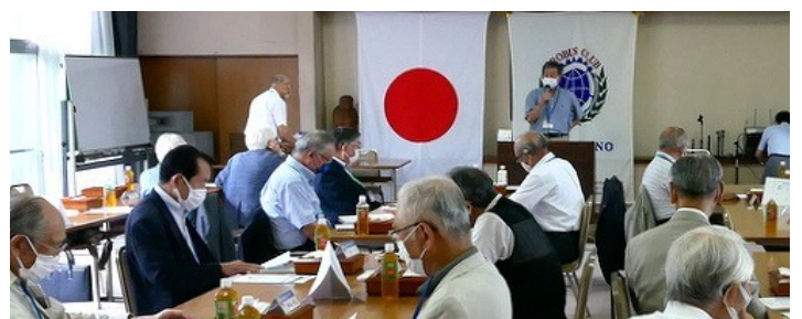
3密に配慮した例会風景