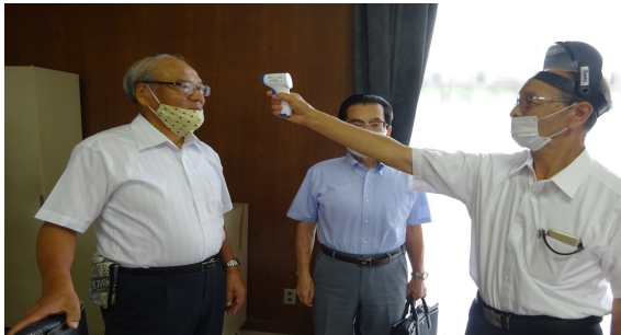
例会準備 検温・除菌・

今日の初例会を開催するに際して、保母副幹事の助言をいただきながら、理事全員の協力参加をいただき、除菌、体温測定、テーブル配置等を実施しての開催となりました。