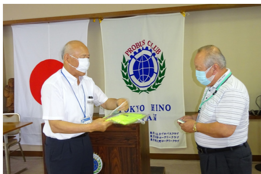
会長より、バッジ・会員手帳・ジャンパーの進呈