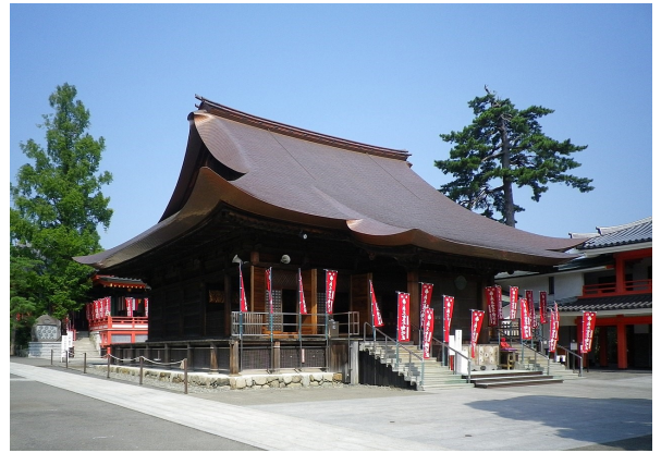
高幡不動尊（金剛寺）

私たち東京日野プロバスケットボールクラブの例会場も高幡不動境内の客間殿にて毎月第三木曜日の12時30分より開催されております。（通常時）